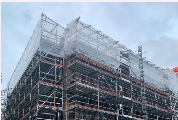
Espoon oikeustalon rakennusaikaisia kuvia.